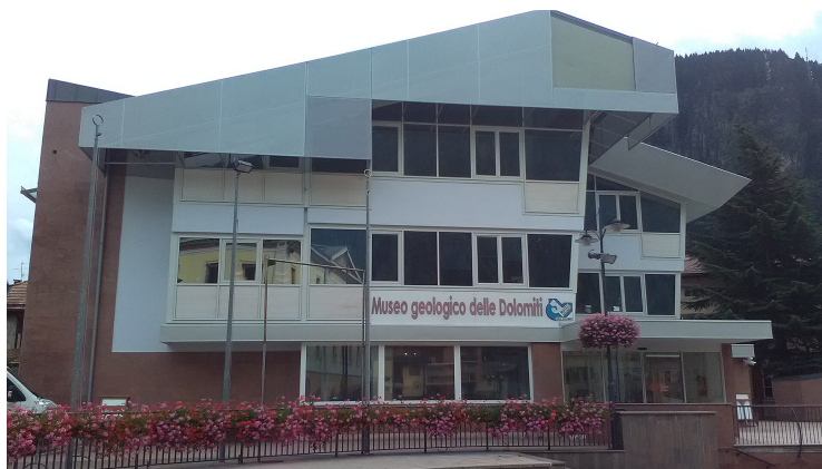
Foto: Holapaco77 · Licenza: CC BY-SA 4.0 · Fonte: Wikimedia Commons

LOCANDA AL TOAL · Val di Fassa, 1650 m s.l.m.