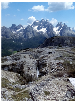
Foto: Samuel Boatto · Licenza: CC BY-SA 4.0 · Fonte: Wikimedia Commons