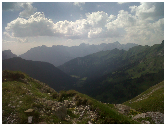
Foto: Gianmarco L95 · Licenza: CC BY-SA 4.0 · Fonte: Wikimedia Commons